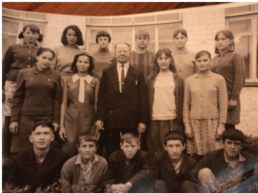
Выпускной 8-й класс